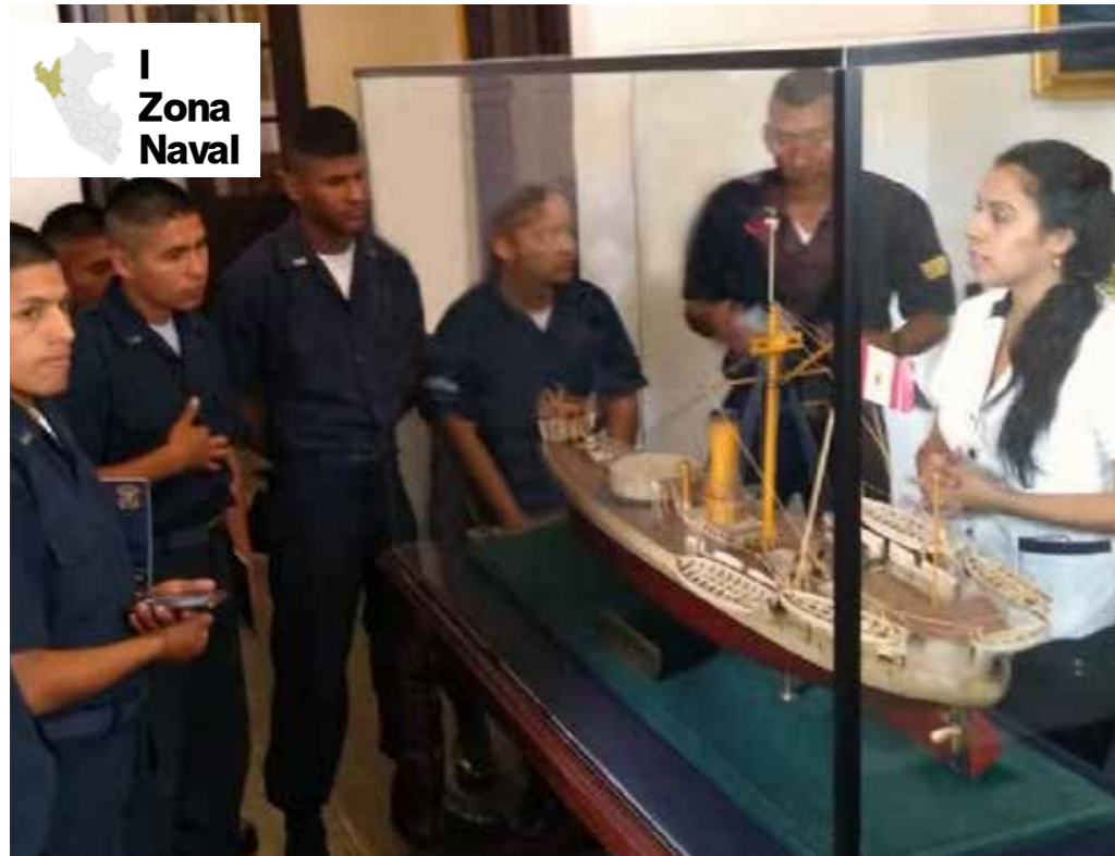
I Zona Naval

Un grupo de jóvenes del Servicio Militar Voluntario perteneciente a la Fuerza Aérea del Perú, realizó una visita cultural al Museo Casa Grau de Piura.