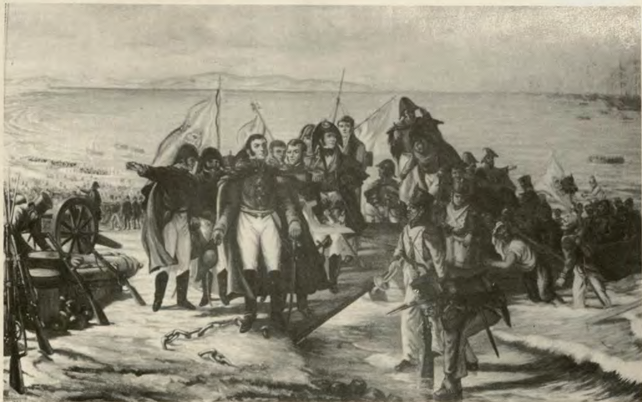
Desembarco de la Expedición Libertadora del Perú, a órdenes de San Martín y en la actual "Bahía de la Independencia" (Paracas)— Colección pictórica: Museo Naval del Perú, Capitán de Navío Julio J .Eliás Murguía.