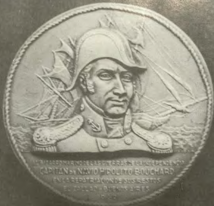
Capitán de Navío Hipólito Bouchard.— Francés de origen. Fue granadero y luego corsario (contra España) en la Argentina. Colaboró con San Martín en la Expedición Libertadora del Perú. Asimilado a nuestra Marina de Guerra, se hizo ciudadano peruano y luchó por la independencia.— Medalla conmemorativa. Colección del autor.