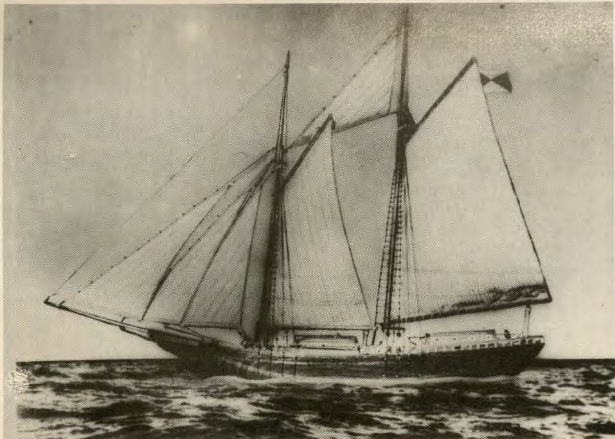
La goleta Sacramento (ex pailebote correo español), fue el primer barco armado que tuvo nuestra Marina Estatal en 1821. Su captura la efectuaron los hermanos Cárcamo y otros tripulantes, en aguas de Máncora.— Maqueta: Museo Naval del Perú, Capitán de Navío Julio J. Elías Murguía.