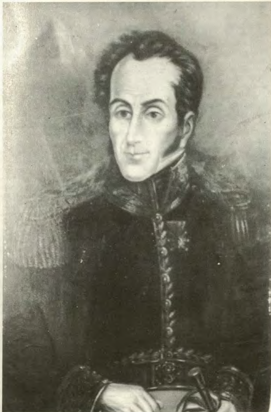
El Libertador General D. Simón Bolívar Palacios.