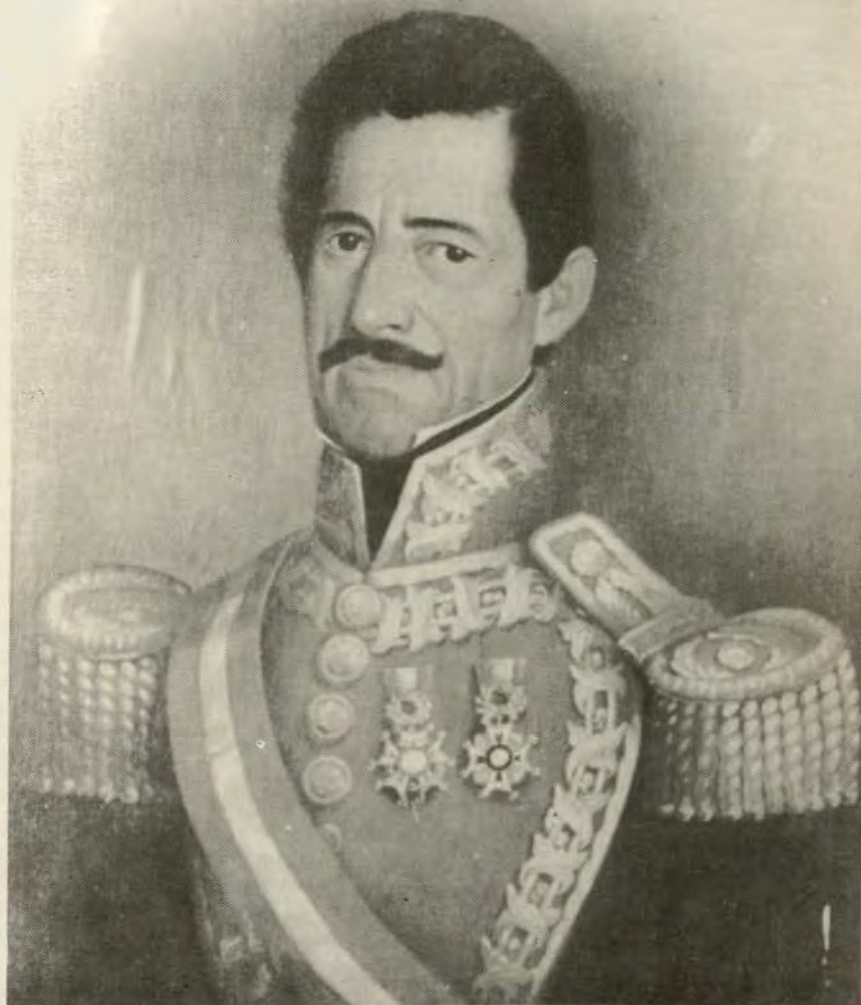
Gran Mariscal, D. Ramón Castilla Marquesado, principal gestor de nuestro gran progreso naval durante el siglo XIX.